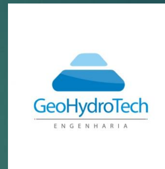
Código de Conduta GHT