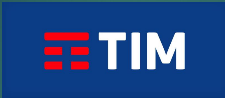
Código de Conduta do Conselho de Usuários da TIM