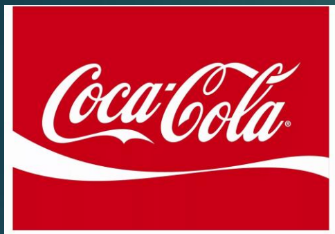
Código de Conduta da Coca Cola Ribeirão Preto - SP